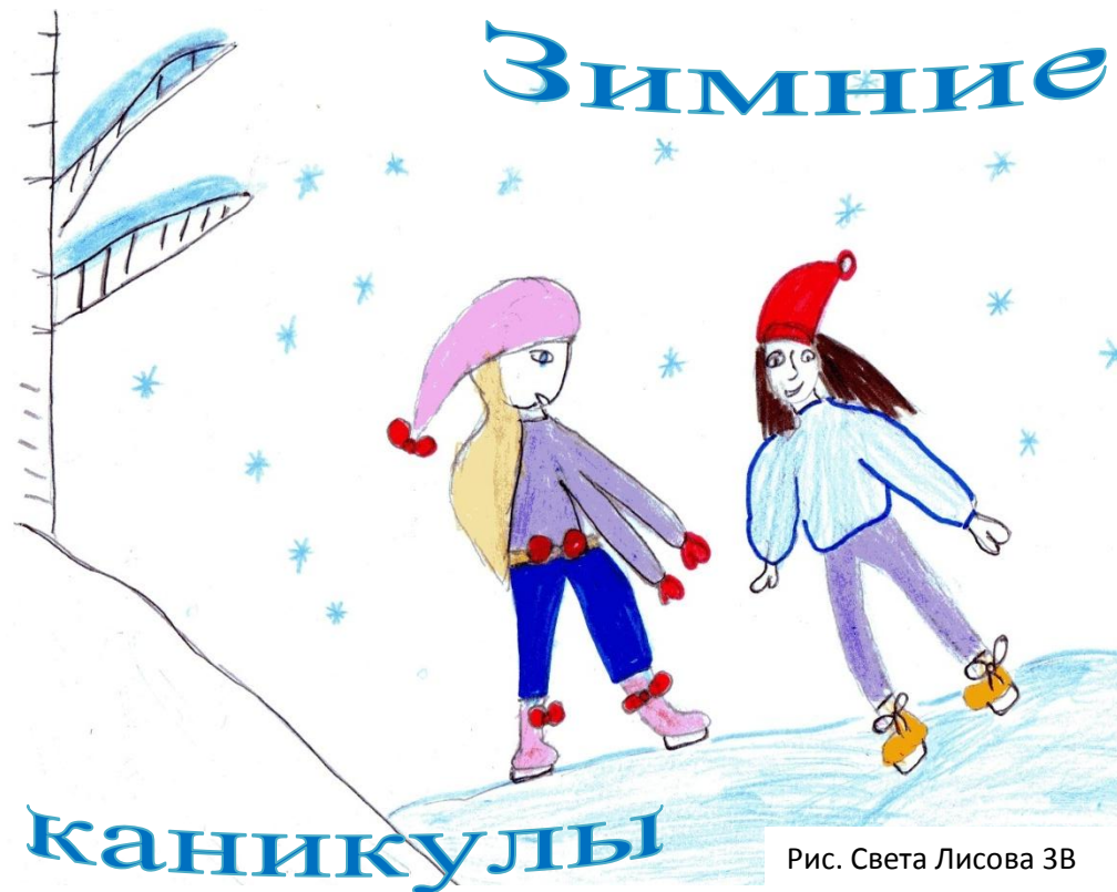
Рис. Света Лисова 3В

Пусть в круге белых лепестков для вас всегда сияет солнце!